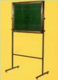
اعلانات شیشه ای