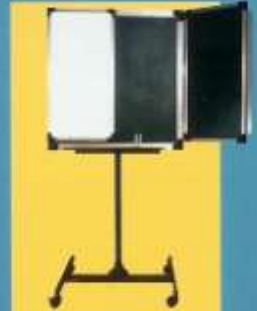
وایت برد لولایی